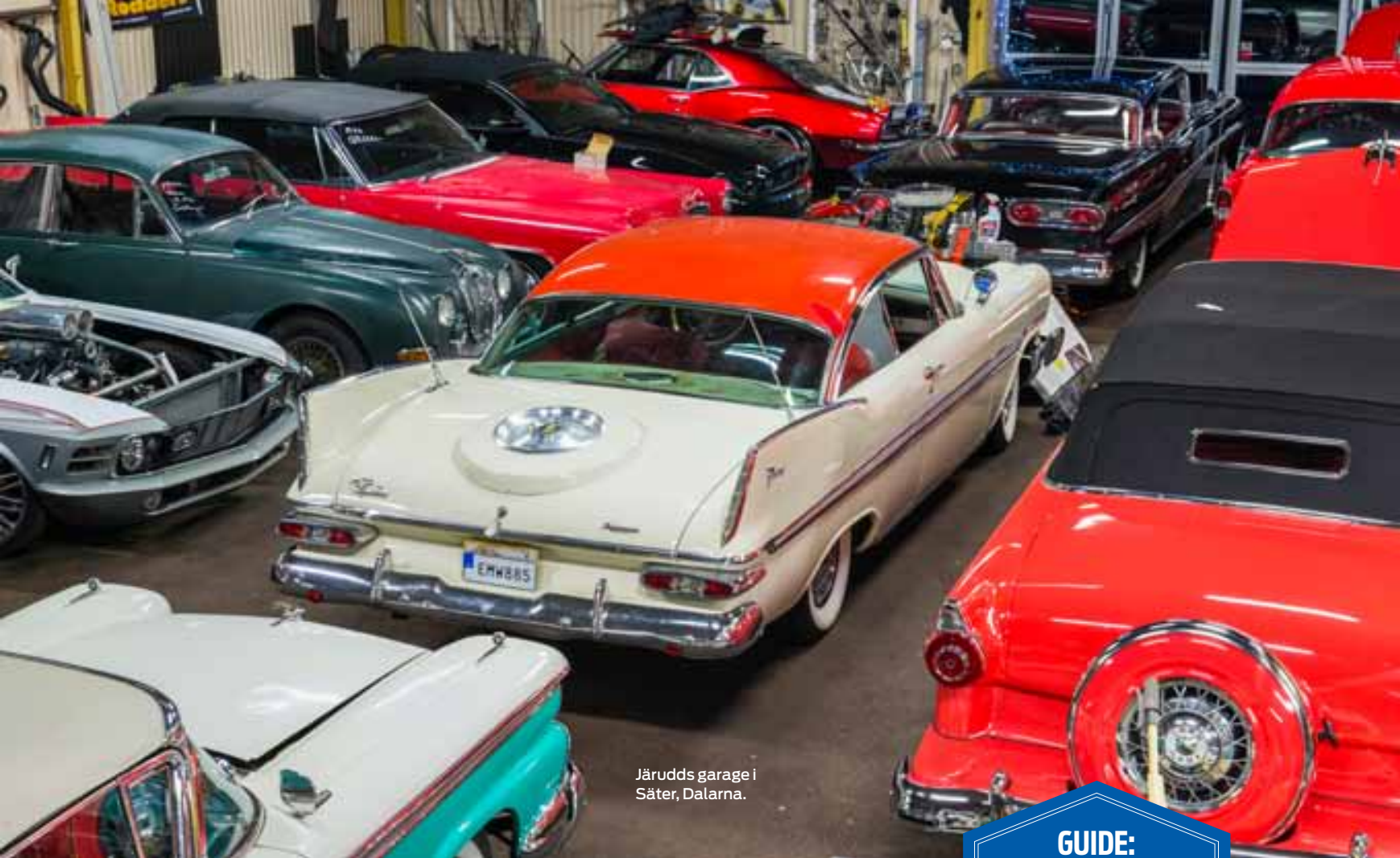
Järudds garage i Säter, Dalarna.